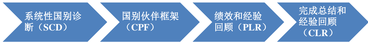
图 1. 与国家合作的新方法